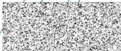
Zdeněk Jírša starosta

Vyvěšeno na úřední desce dne: 15. 03. 2017 Sejmuto z úřední desky dne: - 3. 04. 2017