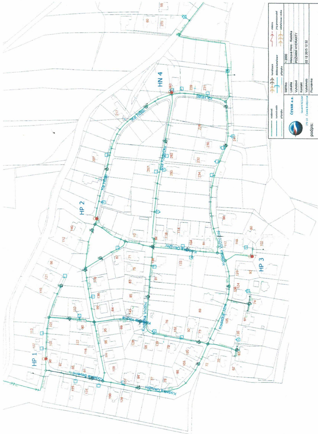
Obr. 2 – Zdroje vody v obci Hlincová Hora - Kodetka

Hydranty: - podzemní (HP 1, HP 2, HP 3) - nadzemní (HN 4)