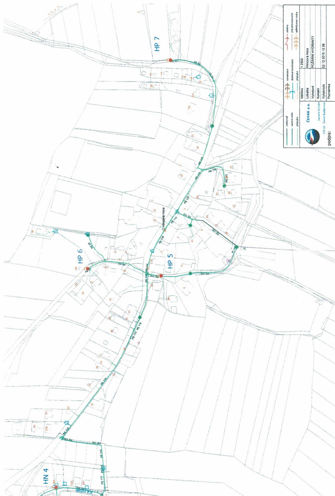
Obr. 3 – Zdroje vody v obci Hlincová Hora – stará část (dokumentace ČEVAK)