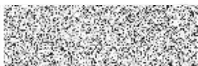
Michal Polanecký místostarosta Města Milevska