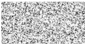
PaedDr. Luděk Štíbr starosta

Toto nařízení nabývá účinnosti dnem 10. 4. 2019