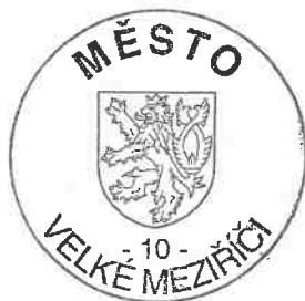
kulaté razítko města