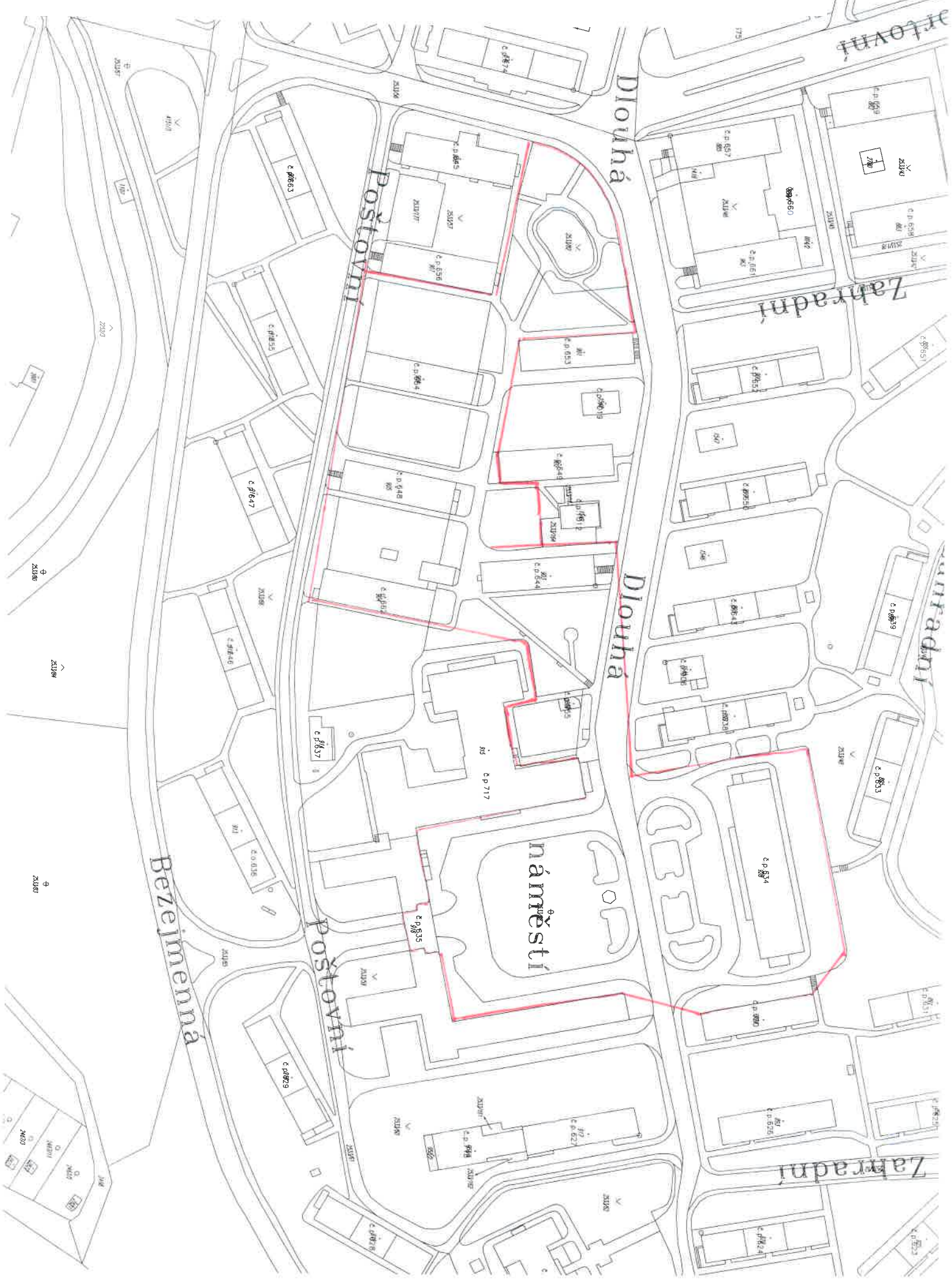
Příloha 1 - Vymezení míst, kde je zákaz požívání alkoholu na veřejném prostranství (5 list)